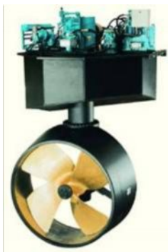
Винто-рулевые азимутальные движители