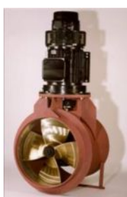
Тоннельные подруливающие устройства