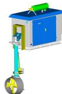
Винто-рулевые колонки палубного базирования