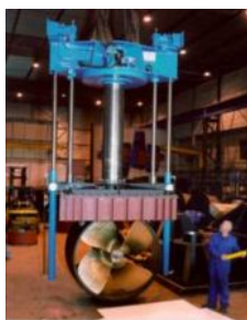
Выдвижные винто-рулевые колонки

Подруливающие устройства для мелководья с возможностью вращения на 360°